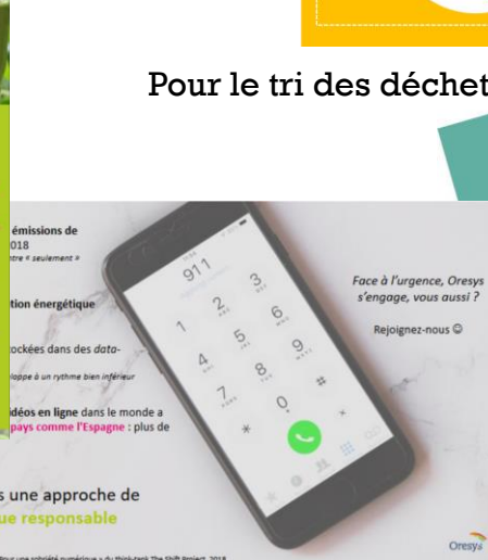
Sensibilisation à la Sobriété Numérique