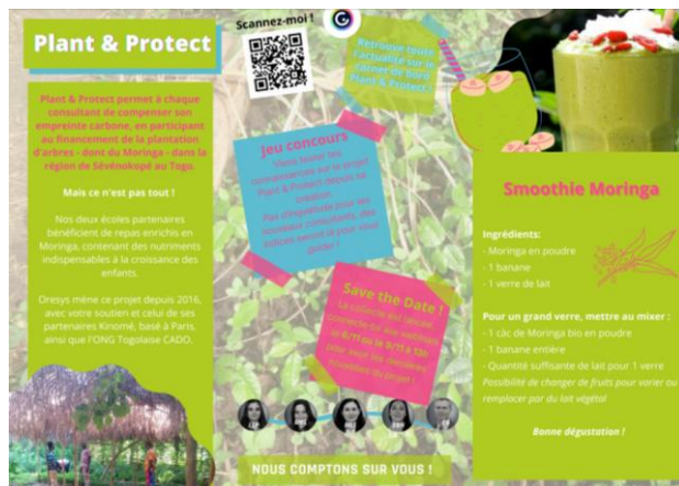
Communication Projet Plant & Protect