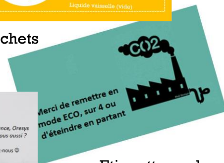
Etiquette sur les chauffages Oresys