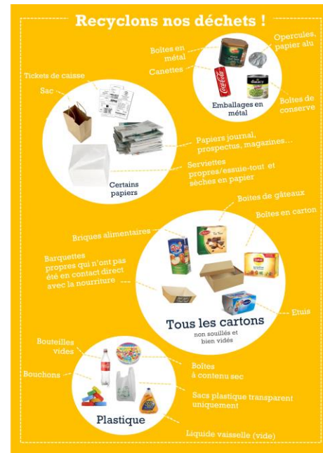
Pour le tri des déchets