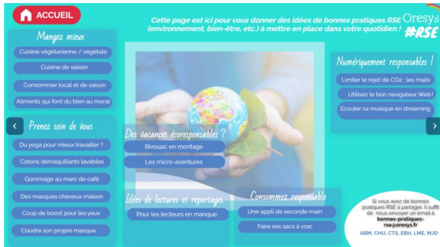
Rubrique RSE dans le journal d'Oresys